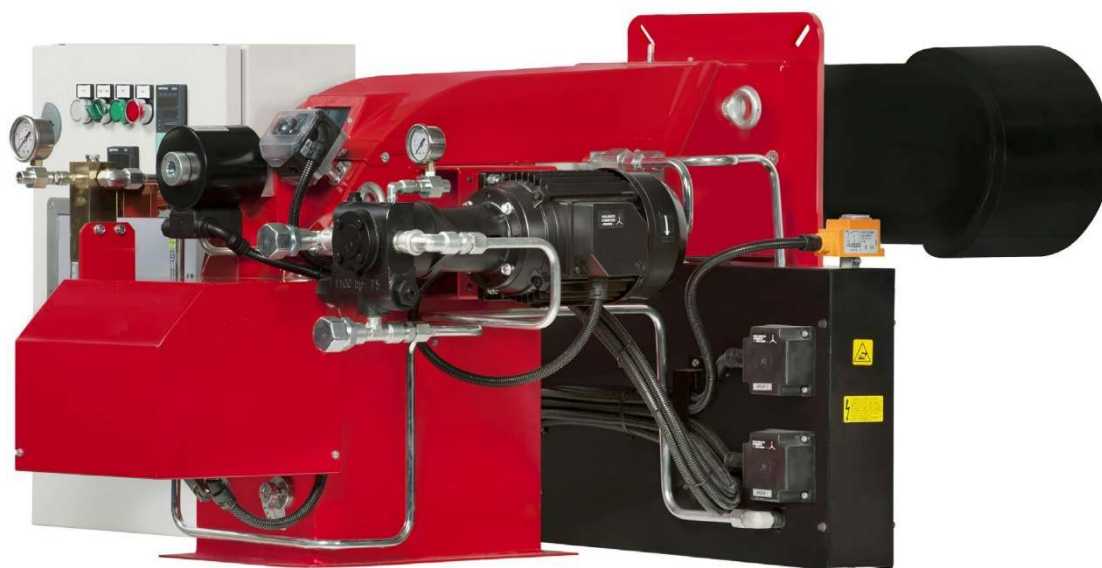
Fig. 3 HI-FSDP 250/M