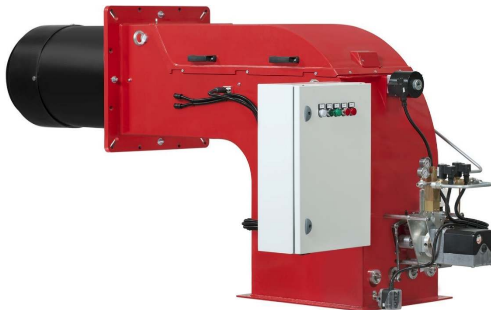
Fig. 2 HI-GSP 650/M