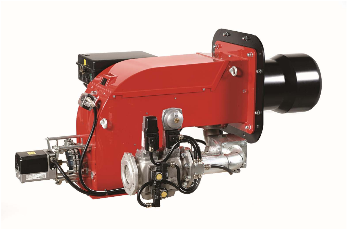
Fig. 4 HI-CP350/M